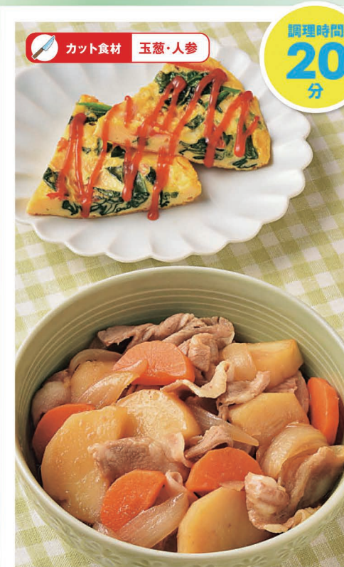
木 ごはんがススム! 豚バラ肉じゃが かにかまとほうれん草のオムレツ