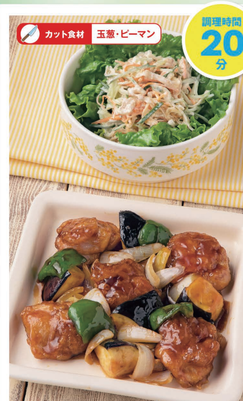
水 鶏肉となすの黒酢だれ 切干大根のごまヨサラダ