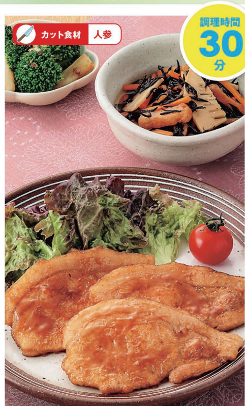
月 豚ロースのくわ焼き 五目揚げとひじきの煮もの・ブロッコリーのおかかあえ