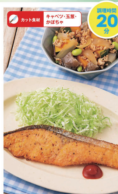
火 サーモンのこんがりチーズパン粉焼き ほっくりかぼちゃのそぼろ煮